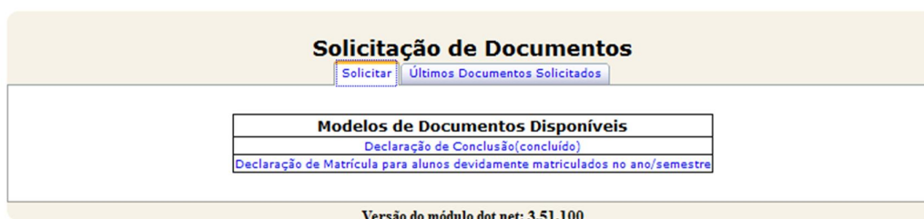
Figura 2 – Modelos de Documentos

Na página de solicitação de documento o aluno deverá clicar no link com o nome do tipo de documento desejado (fig. 2).